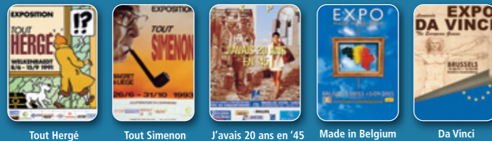
Tout Hergé Tout Siméon J'avais 20 ans en '45 Made in Belgium Da Vinci

asbl Europa 50 asbl Collections & Patrimoines