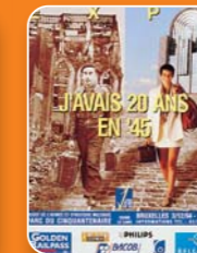
J'avais 20 ans en '45