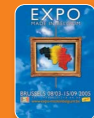
Made in Belgium