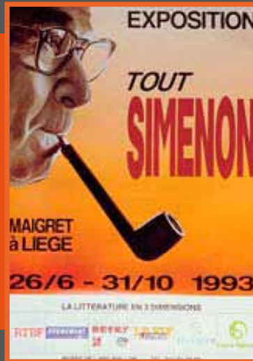
«Tout Simenon» tentoonstelling 25 Juni > 15 November 1993 200.000 bezoekers. Musée de l'Art Wallon à Liège.