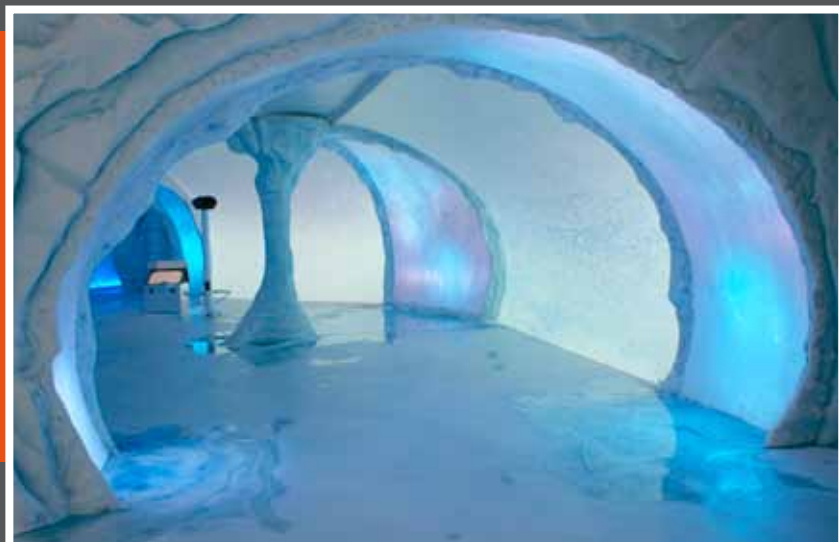
Het decor van de gletsjer