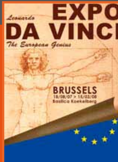
Expo « Leonardo da Vinci , The European Genius » tentoonstelling 18 Augustus 2007 > 6 April 2008 350.000 bezoekers. Basiliek van Koekelberg.