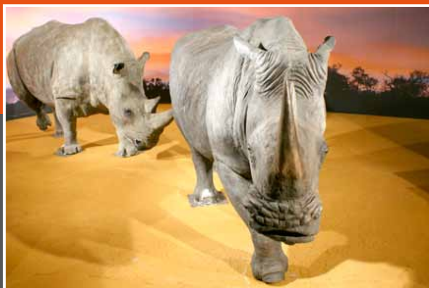
Het decor van de bedreigde biodiversiteit