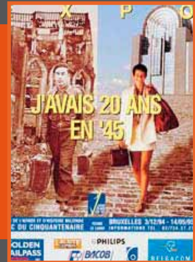
«J'avais 20 ans en 45» tentoonstelling December 1994 > November 1995 750.000 bezoekers. Koninklijk Museum van het Leger en de Krijgsgeschiedenis, Brussel.