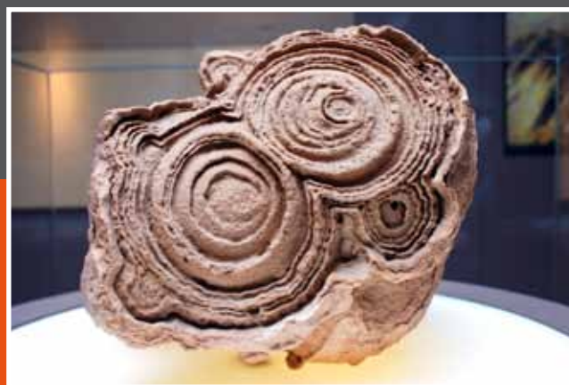
Stromatolieten (eerste levende cellen)