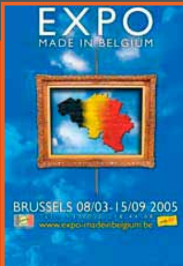
« Made in Belgium » tentoonstelling 8 maart 2005 > 26 februari 2006 375.000 bezoekers. Kunst centrum Dexia, Brussel.