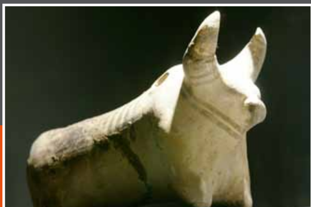
Buffel van de Indus Vallei (-3500 ACN)