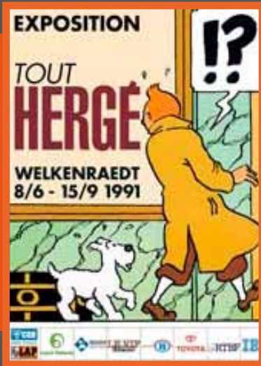
«Tout Hergé» tentoonstelling 6 Juni > 15 September 1991 250.000 bezoekers. Welkenraedt.